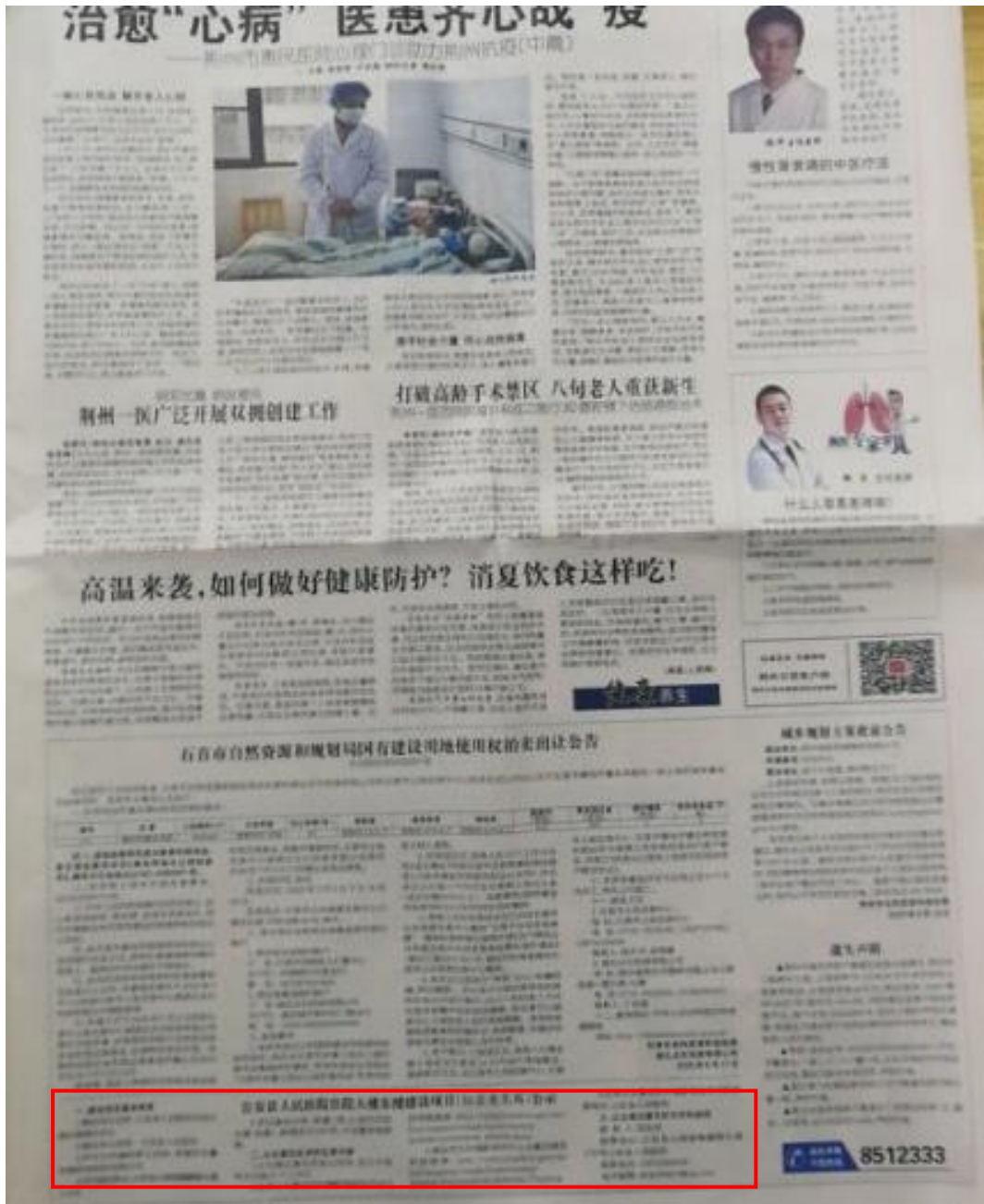
图 3-4 公安县人民医院住院大楼东楼建设项目环境影响报告书（征求意见稿）公开信息报纸公示（2020 年 6 月 15 日）