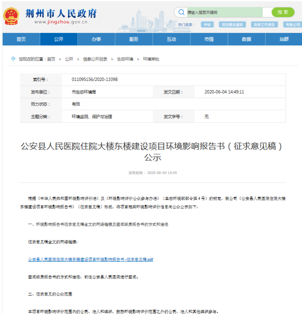
图 3-2 公安县人民医院住院大楼东楼建设项目环境影响报告书（征求意见稿）公示